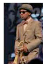
Roy Hargrove